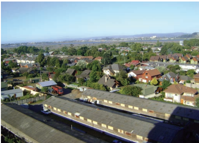
Urbanización cercana al río Biobío, aledaña al puente Juan Pablo II en Concepción

Contar con un PRC actualizados permite, en el ámbito normativo (1), fomentar la construcción de casas y departamentos en barrios que hoy lucen abandonados y deteriorados, (2) ampliar la facultad de los municipios para expropiar viviendas y así mejorar por ejemplo, la conectividad vial, (3) normar mayores alturas para que así las inmobiliarias inviertan en terrenos y los propietarios puedan acceder a otros barrios, (4) recuperar los barrios antiguos, (5) desincentivar la construcción de edificios insertos en sectores residenciales en donde prevalecen las casas (Revista Se Construye , 2009 9 ). Asimismo, los planes reguladores actualizados permitirían en el ámbito económico: (1) atraer inversión que busque valorizar las cualidades de la comuna (DDU 2009), y (2) responder a la necesidad de proyectar adecuadamente el crecimiento de las ciudades en el futuro, incorporando criterios de integración, sustentabilidad y participación social (Declaración Ministerio de Vivienda y Urbanismo, 11 abril 2007, refiriéndose a la actualización del PRMS 10 ). Bajo estas consideraciones se cumpliría con un requisito importante mencionado en la circular 55 de la DDU (2009): ser oportunos. En este contexto, en algunas comunas del gran Santiago se están acelerando los procesos de aprobación de Planos Reguladores, puesto que de lo contrario estas crecen sin normas y con aumentos crecientes de los conflictos urbanos que se instalan sin una regulación adecuada.