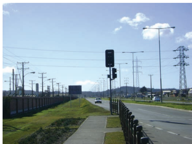
Sector Hualpén en Concepción

En este marco, este estudio permitió conocer, la percepción de algunos de los actores involucrados. En el caso de profesionales de la Secretaría Regional Ministerial de Vivienda y Urbanismo de la Región del Biobío, manifiestan una percepción positiva con respecto a las bondades del PR en temas relacionados con la conectividad y accesibilidad vial, así como en aspectos ambientales, los que en general, estarían cubiertos en el PRC. Sin embargo, las vías principales o estructurantes de algunas comunas como San Pedro de la Paz, en horas pick quedan colapsadas, situación que podría estar dando cuenta de que los IPT no estarían respondiendo a las necesidades actuales (Cuadro 5). Estos problemas del transporte urbano no se resolverán si son ignorados en las políticas habitacionales y en las de localización de equipamiento y fuentes laborales (Betsalel 2001). En este marco el reciente terremoto de febrero de 2010 tendrá serias implicancias en el próximo plan regulador.