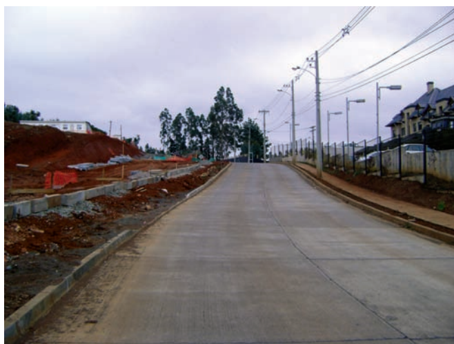
Urbanización fundo El Venado en Concepción

Para disminuir la brecha de las comunas sin PRC se requiere un esfuerzo especial de los organismos públicos,