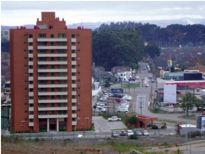
Avenida Los Canelos en Concepción.

anteriores, si consideramos, como promedio de elaboración 420 días corridos y comparando con los resultados de este estudio, para el caso de los PRC inconclusos, el 76% de estos debieron haber sido terminados según las fechas de inicio registradas en este estudio (Cuadro 3).