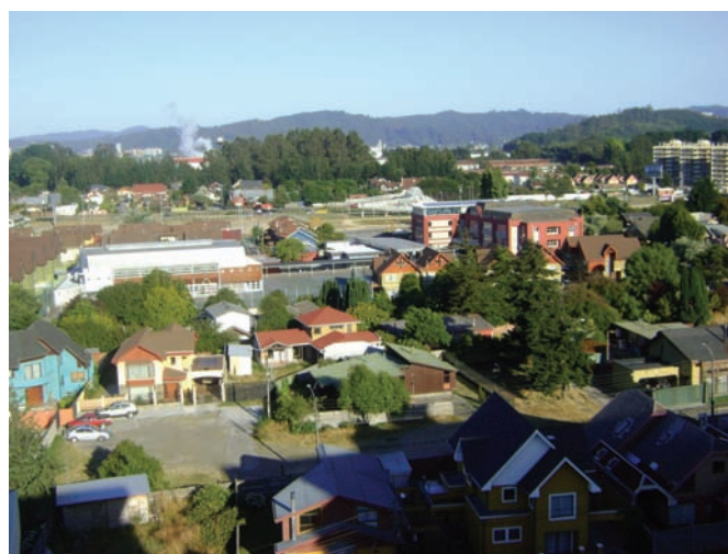
La planificación urbana facilita la coherencia en la organización de las actividades en los distintos espacios

Dada la importancia de los PRC, a comienzos de los años 90 y como una de las principales tareas que se planteó el gobierno de la época fue iniciar un proceso de actualización y modernización de la administración pública en todos sus niveles, en él se plantearon dos objetivos principales (1) hacer más eficientes los servicios públicos y (2) fortalecer la democracia por medio de una gestión pública participativa (Comité Interministerial de Modernización de la Gestión Pública 1994-2000 en Montecinos, 2006). Para dar cumplimiento a estos objetivos, los municipios fueron integrados completamente, y a partir del año 1994 la Subsecretaría de Desarrollo Regional y Administrativo (SUBDERE) a través del Programa de Fortalecimiento Institucional Municipal (PROFIM), comenzó la modernización de tres instrumentos de planificación local para incorporar en éstos nuevas tecnologías y fortalecerlos, dichos instrumentos son, según la Ley Orgánica Constitucional de Municipalidades N° 18.695, (1) El plan Regulador Comunal, (2) el Presupuesto Municipal y (3) el Plan de Desarrollo Comunal (ver Montecinos, 2006).